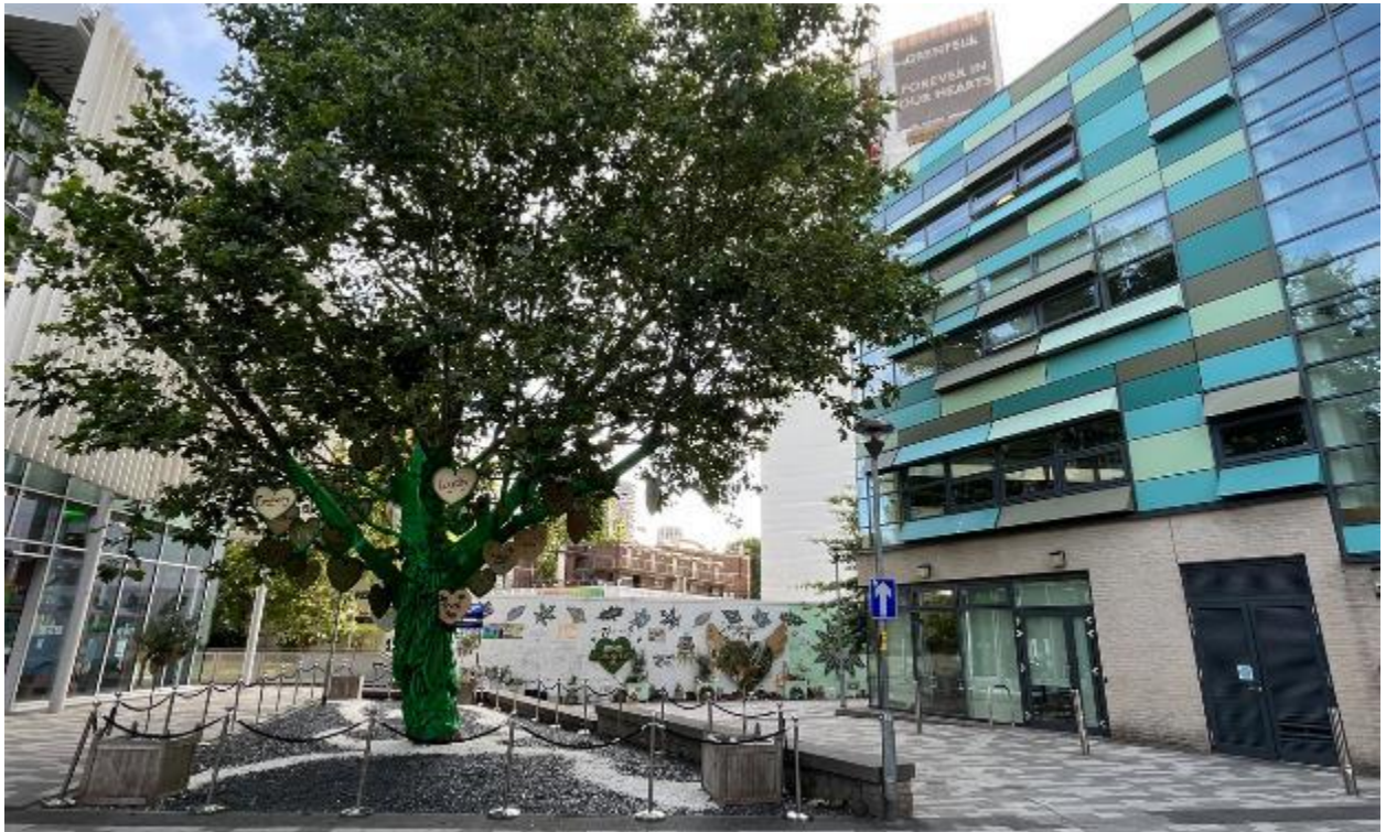
Larawan ng site 8: Access ng pedestrian sa pagitan ng Kensington Leisure Center at ng Academy (06/07/23)