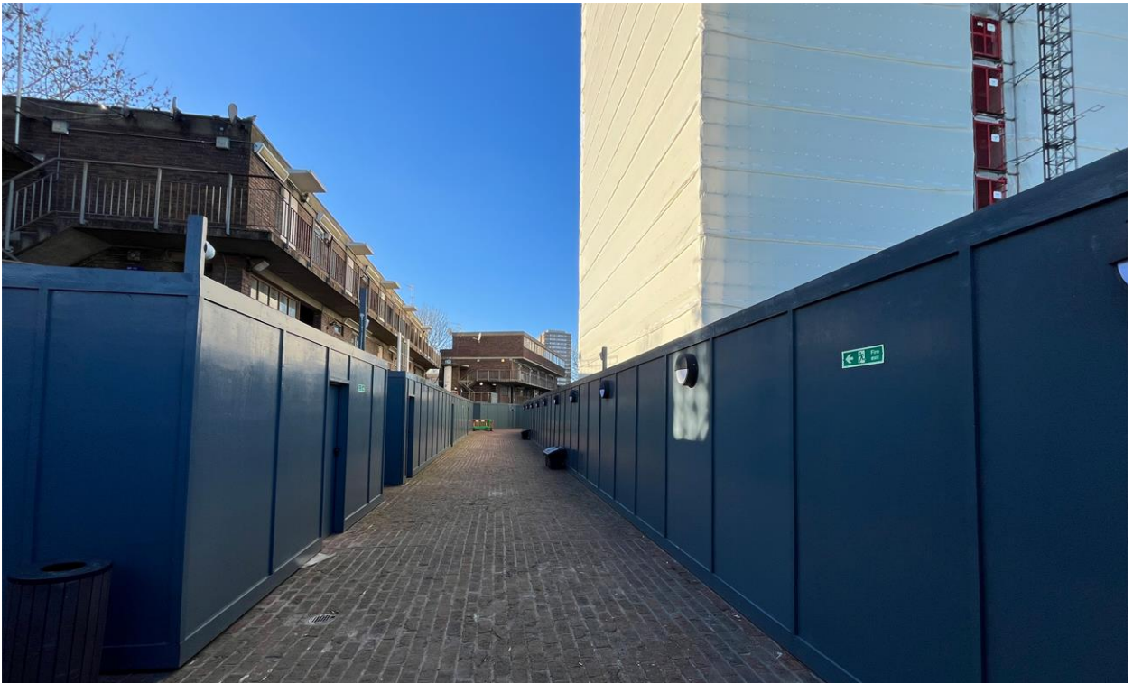
Larawan ng site 12: Silangang bahagi ng nakataas na daanan ng Grenfell Walk at hoarding (18/01/24)