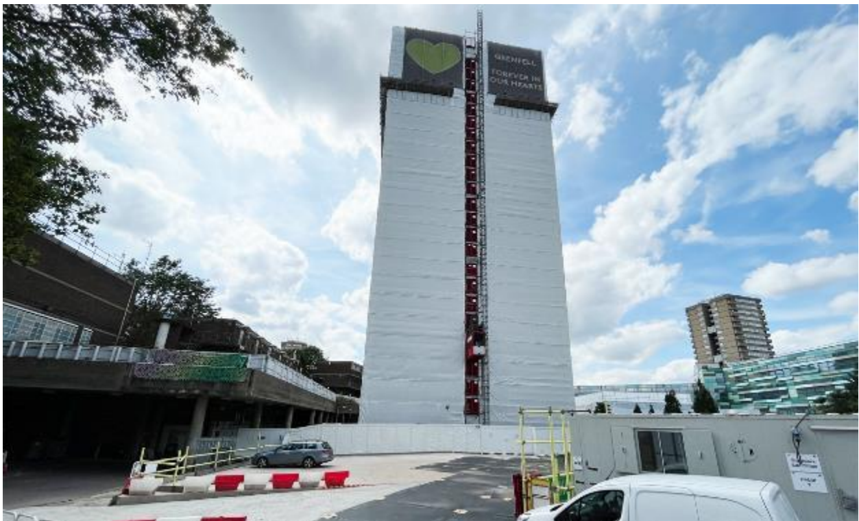
Larawan ng site 4: Kanluran ng buong silangang bahagi ng site ng memoryal (06/07/23)