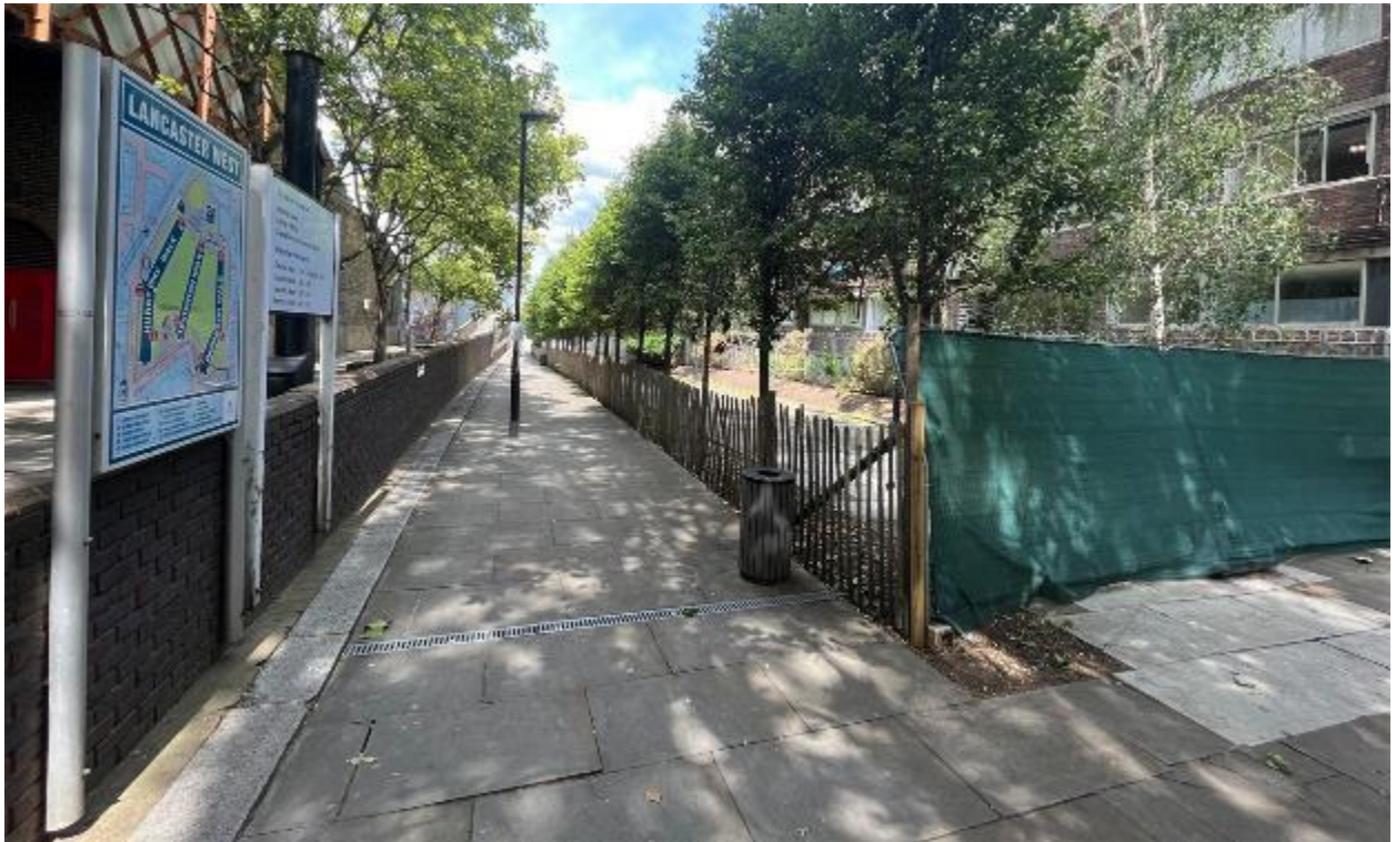
Larawan ng site 1: Kahabaan ng Station Walk na access ng pedestrian sa kanto ng Bramley Road (06/07/23)