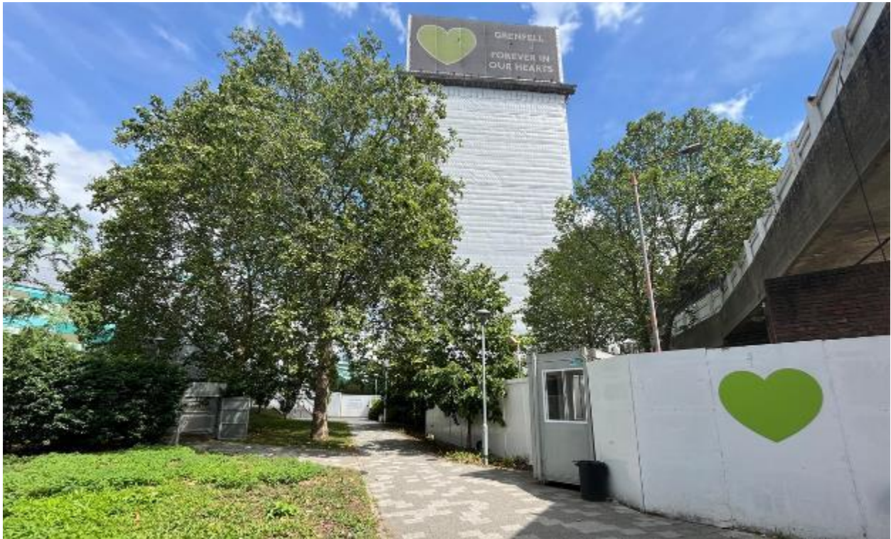
Larawan ng site 3: Silangan patungo sa site ng memorial na kasalukuyang nasa secured na lugar ng site (06/07/23)