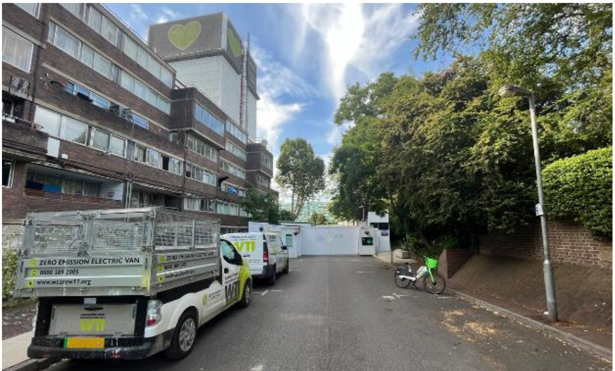
Larawan ng site 6: Grenfell Road malapit sa secured na pasukan ng site (06/07/23)