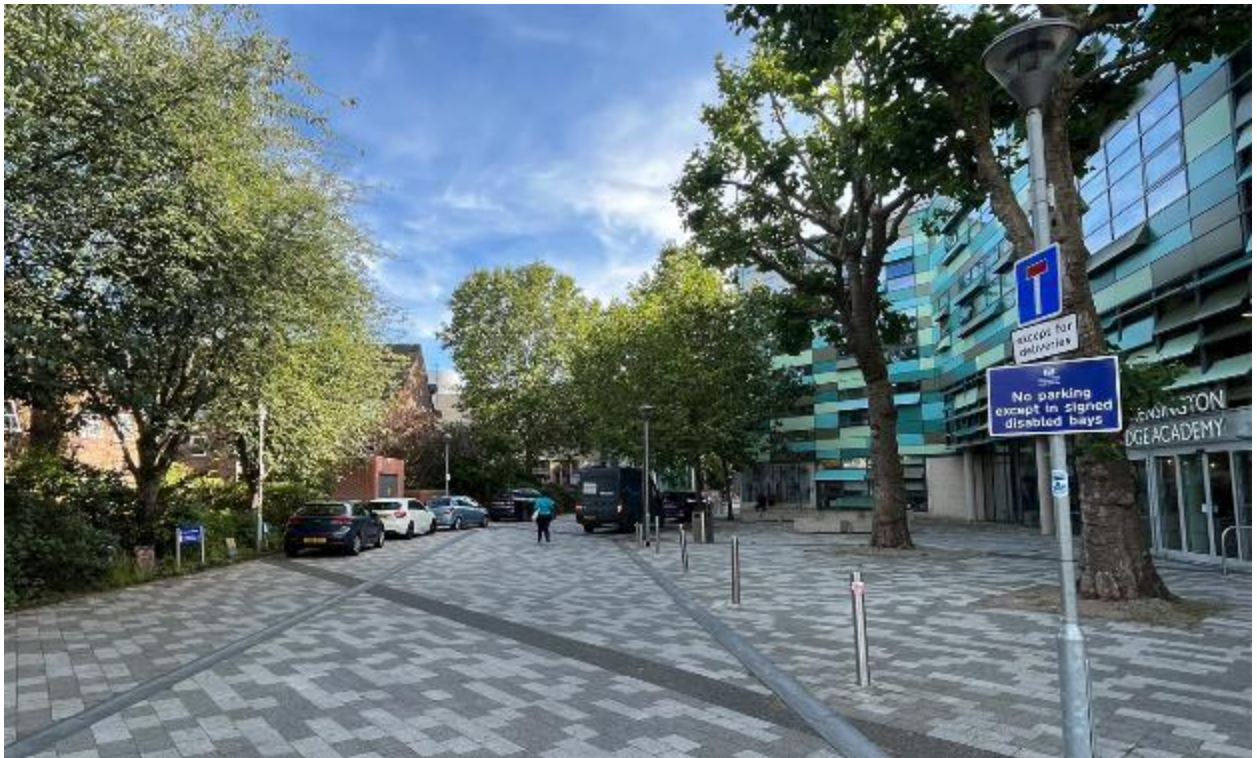
Larawan ng site 7: Access ng pedestrian sa Kensington Aldridge Academy at Silchester Road (06/07/23)