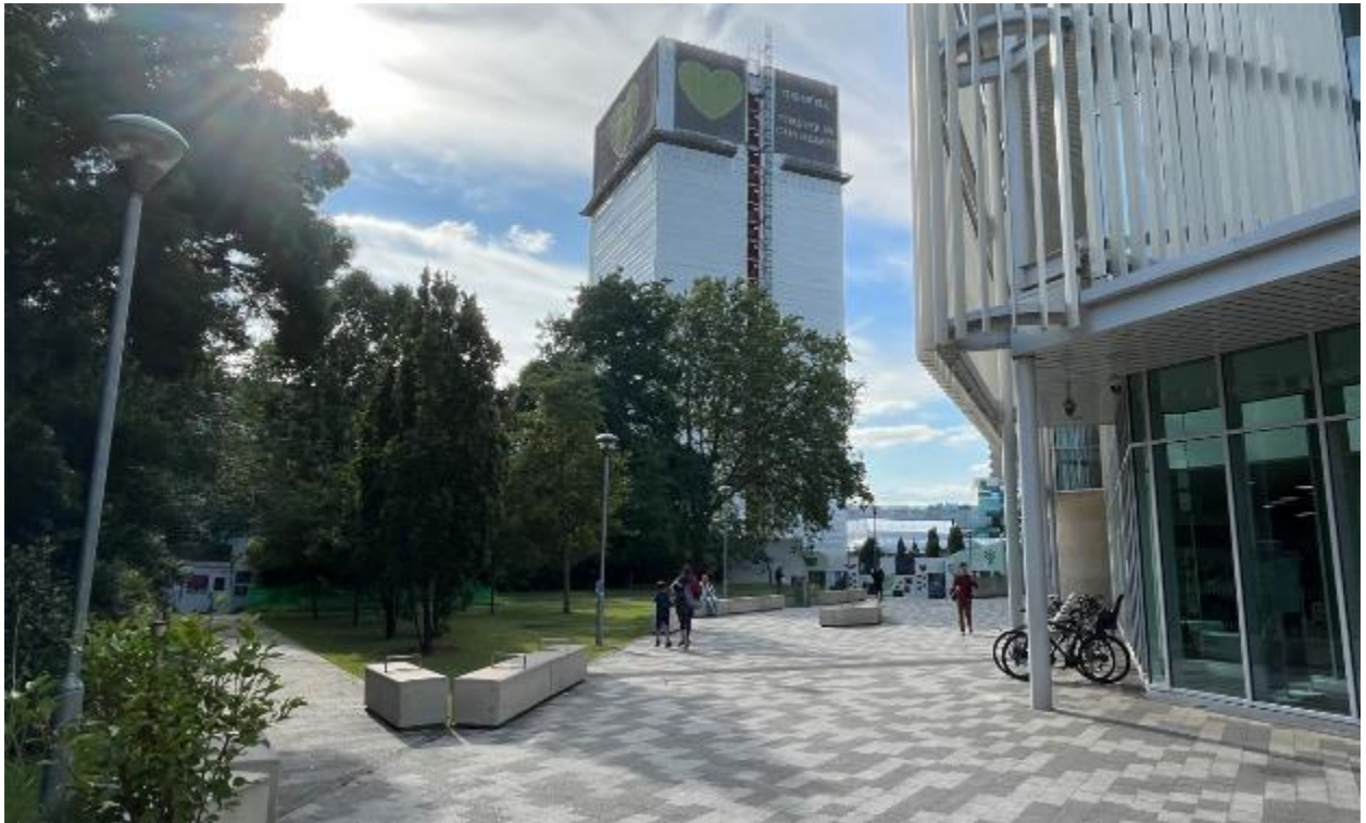
Larawan ng site 9: Access ng pedestrian mula sa timog silangan ng Kensington Leisure Center (06/07/23)