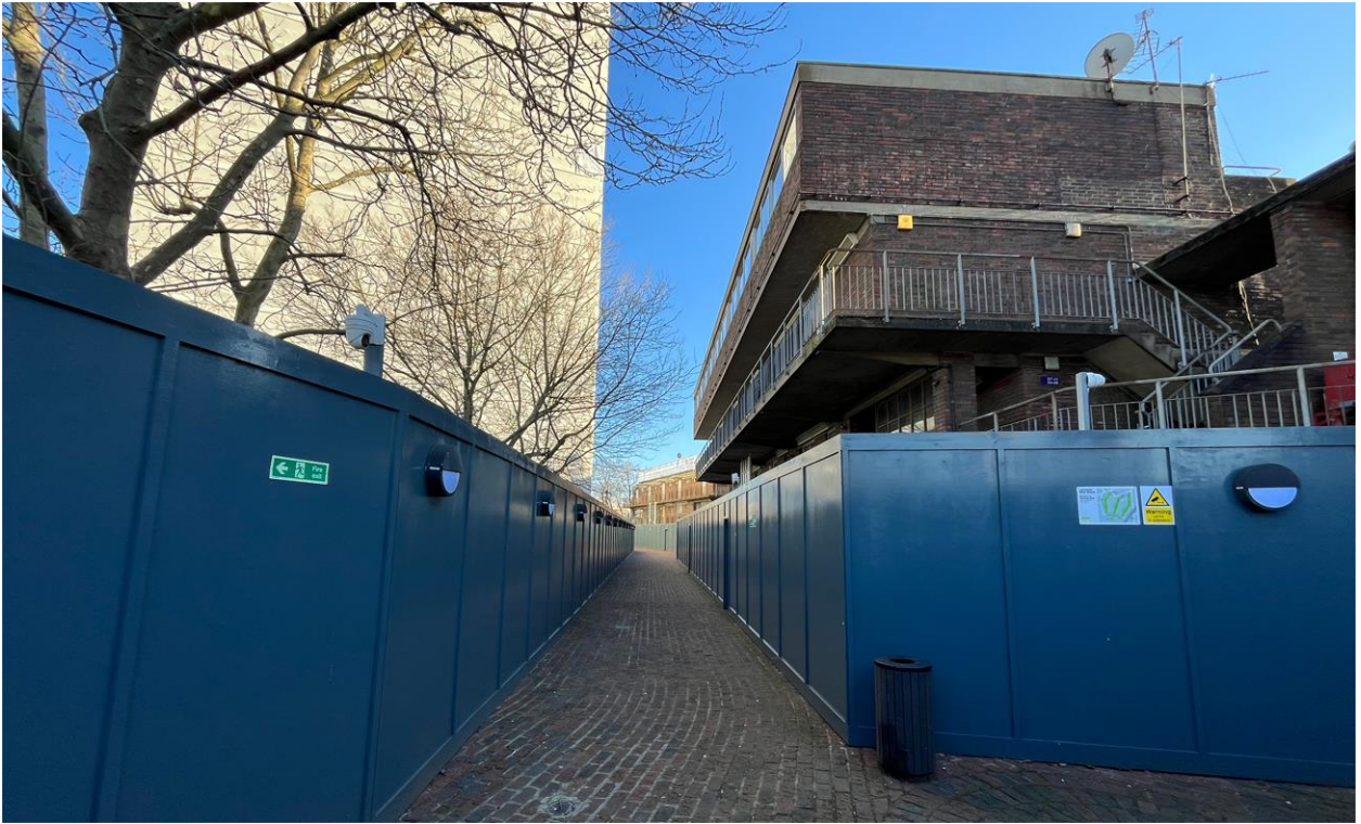
Larawan ng site 11: Kanlurang bahagi ng nakataas na daanan ng Grenfell Walk at hoarding (18/01/24)