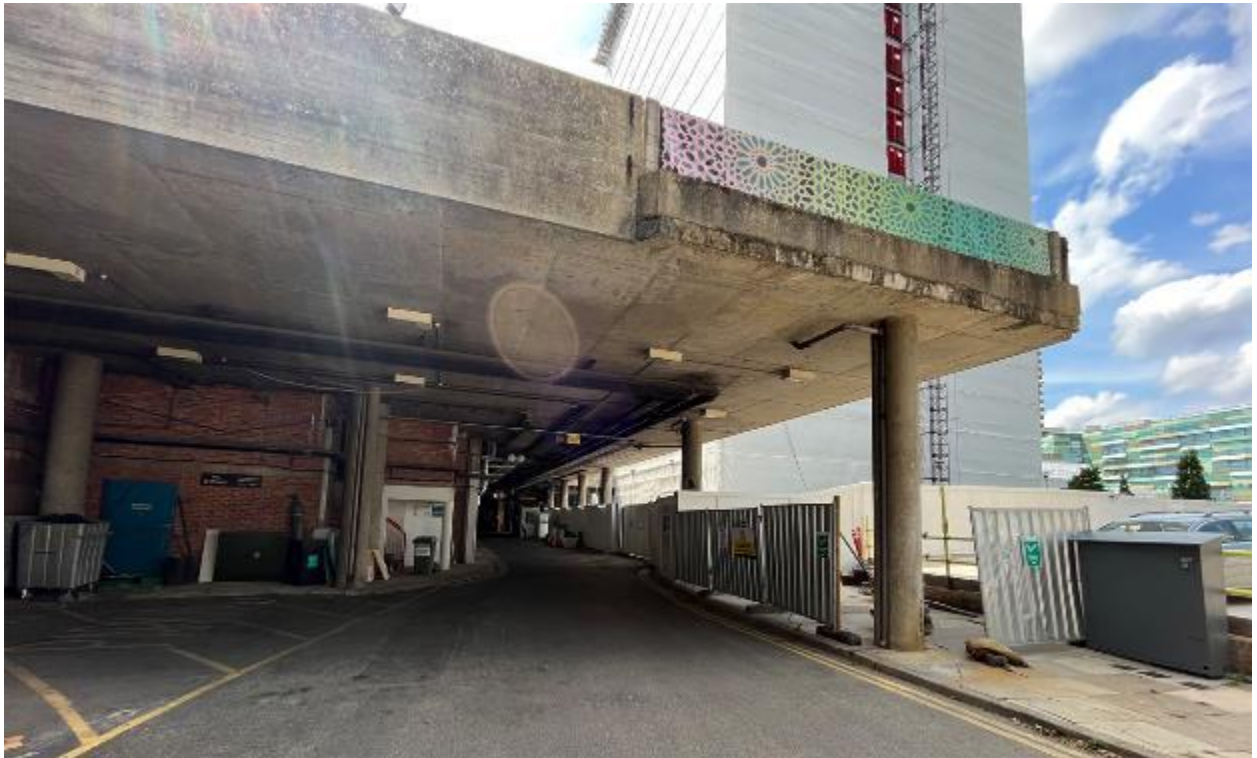
Larawan ng site 5: Tinakpang service road sa timog na hangganan ng site ng memorial (06/07/23)