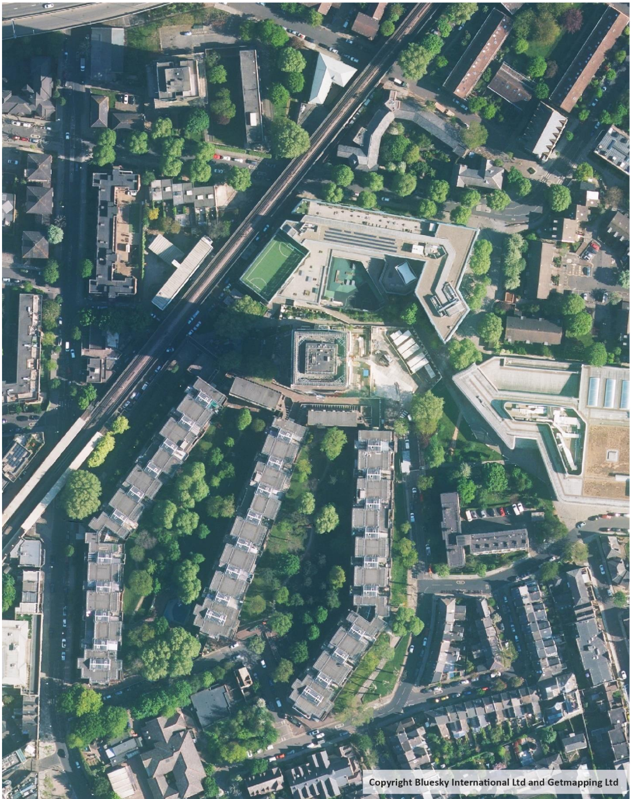
Data ng aerial mapping: Copyright Bluesky International Ltd and Getmapping Ltd