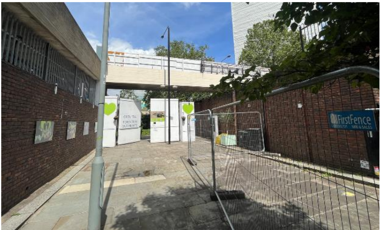
Larawan ng site 2: Itaas ng Station Walk sa secured na pasukan ng site (06/07/23)