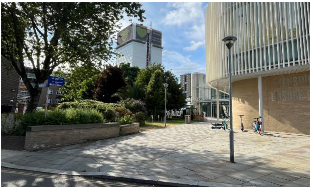
Larawan ng site 10: Access ng pedestrian mula sa Bomore Road sa Kensington Leisure Center (06/07/23)